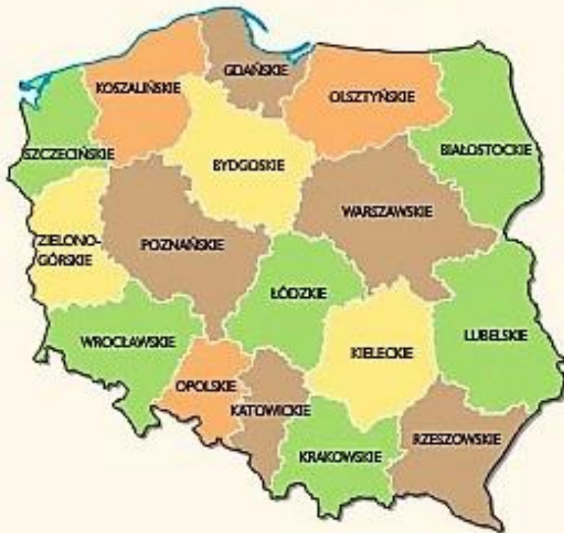
Podział z 1950 roku